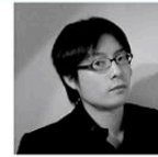
東 俊介 Shunsuke Azuma

1982年千葉県出身。東京音楽大学、同大学院、アムステルダム音楽院およびデン・ハーグ王立音楽院を修了。インドネシア政府奨学金および野村財団より助成を受け、インドネシア国立芸術大学スラカルタ校でジャワ・ガムランの演奏と理論を学ぶ。芥川作曲賞や出光音楽賞など多数受賞。作品の題材によって様々な作曲スタイルを用いながらも、斬新なオーケストレーション、細やかな音形や特殊奏法などによって造られる音響のテクスチュアと色彩が、小出の作風を特徴づけている。